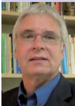
Bezirksdiakonieparrer und Dipl.-Diakoniewissenschaftler